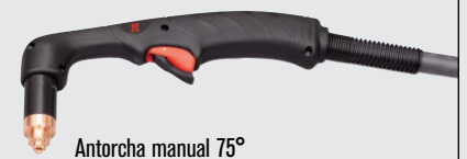
Antorcha manual 75°

(visitar www.hypertherm.com para más opciones de antorchas)