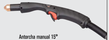
Antorcha manual 15°